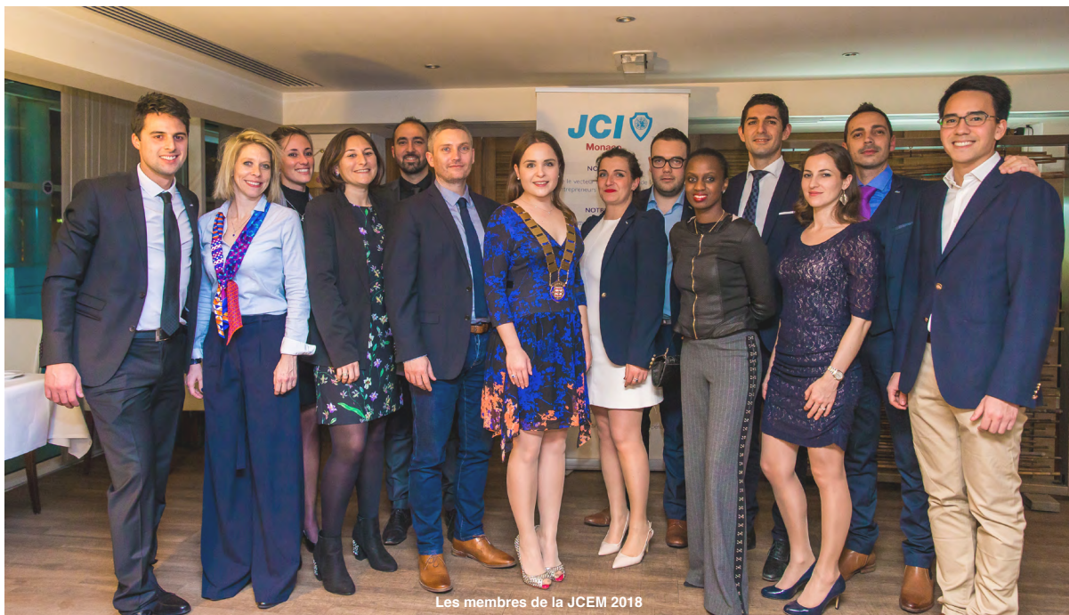
Les membres de la JCEM 2018

Retrouvez les photos et logos officiels sur [ https://jcemonaco.mc/fr/kit-de-communication ]